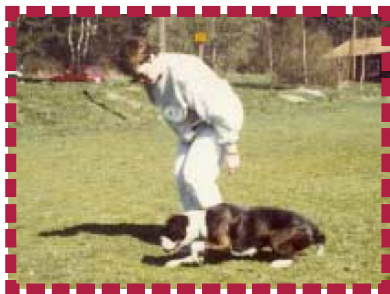
Belöna när hunden saxar bakbenen

Om det finns en skryptunnel på klubben kan man så småningom låta hunden krypa igenom denna.