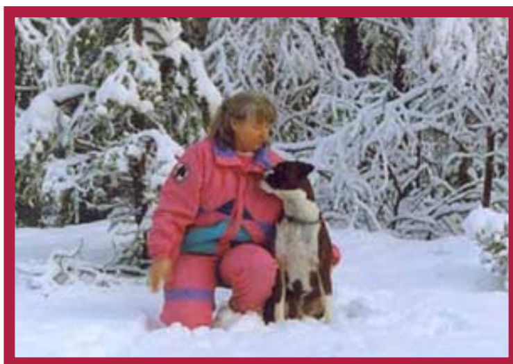
Var förtrolig med din hund

Jag måste kommunicera med min nya hund! Ex.vis när man varit ute och jobbat med hunden kan man sätta sig bredvid den och titta den djupt in i ögonen och tala om hur duktig den varit som “spårat”, “letat apport”, “hoppat”, eller vad den nu har gjort. Speciellt när den lärtsig något nytt. Det finns signalkänsliga (ranglåga) hundar som inte vågar titta en i ögonen (eftersom det är en aggressiv handling) och då får man naturligtvis inte göra det, men man kan ändå vara förtrolig med sin hund och tala om hur duktig den är. Så småningom kanske den överkommer sitt obehag och tårs titta en i ögonen.