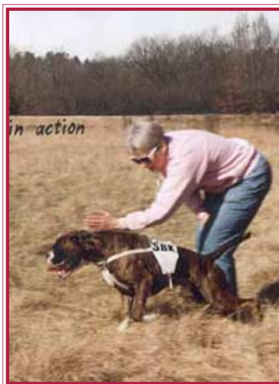
Där ute är figuranten - SÖK

Sökträningens nosarbete fortsätter jag med när hunden är uppflyttad ur apellklass och spåret verkligen är befäst.